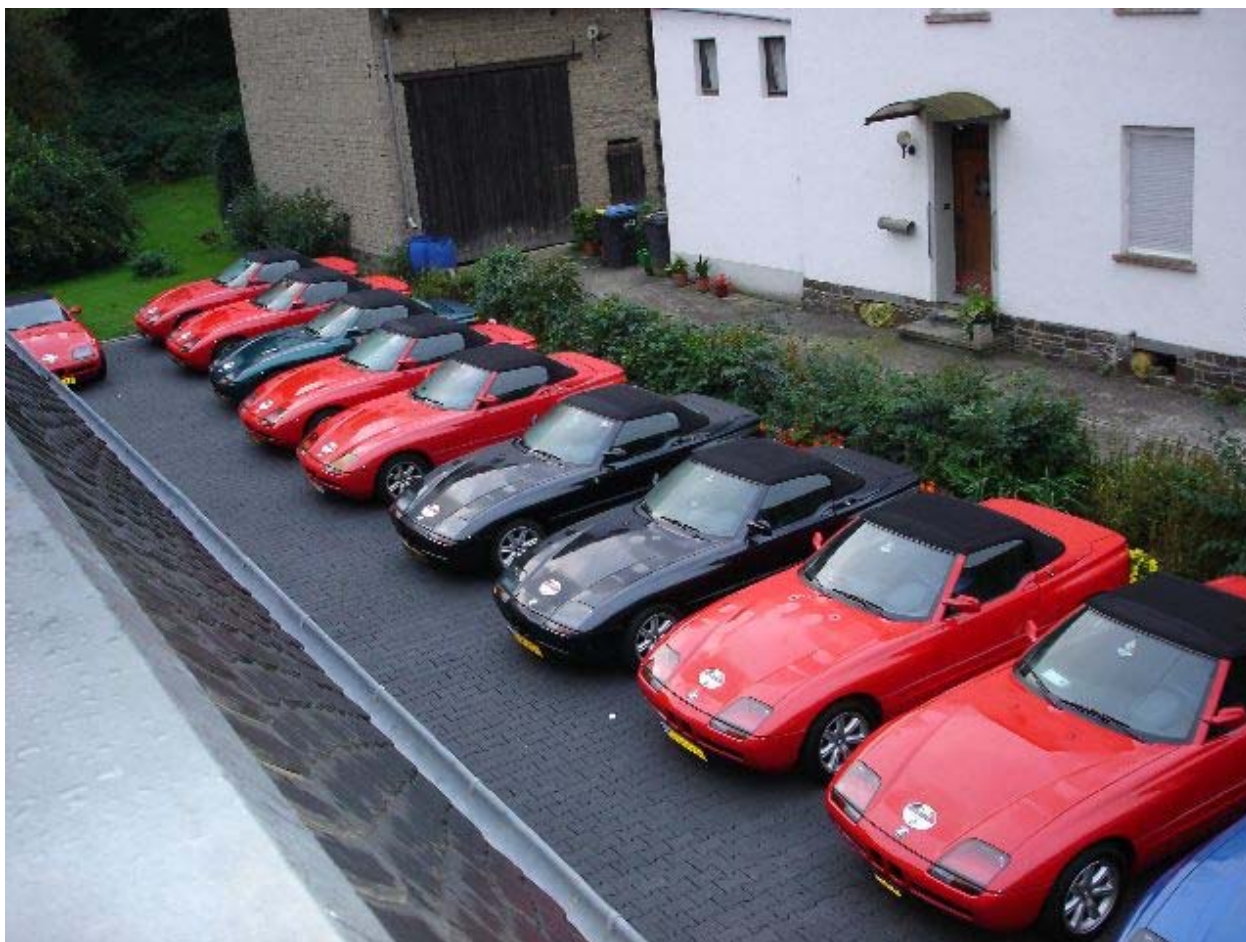
foto gemaakt tijdens de Eifel rit 2006.